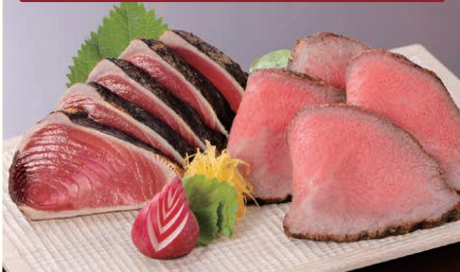
※写真は「黒毛和牛ローストビーフ・鰹のたたきセット」のイメージ写真です。