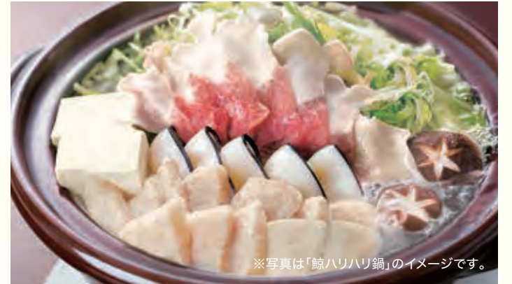
※写真は「鯨はりはり鍋」のイメージです。

ふるさとの格別なごちそう鍋 「鯨はりはり鍋」 希少価値の高い厳選された鯨肉と 秘伝のだしを贅沢に使ったスープは、 鯨肉の旨みと溶け合い絶妙の味わいに。 江戸時代から続いた高知の捕鯨文化。 「おらんくの池にや、潮吹く魚が泳ぎよると よさこい節にも歌われ、親しまれてきました。 ふるさとに思いをよせて。 心と体が芯まであたたまる格別なお鍋です。