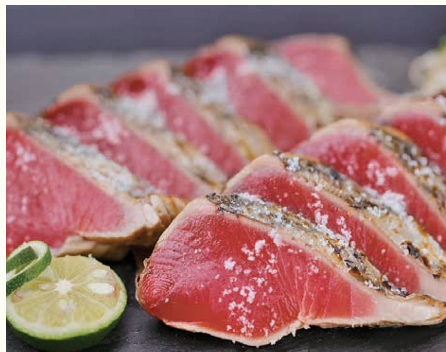
※写真は「鰹の塩たたきセット」のイメージです。