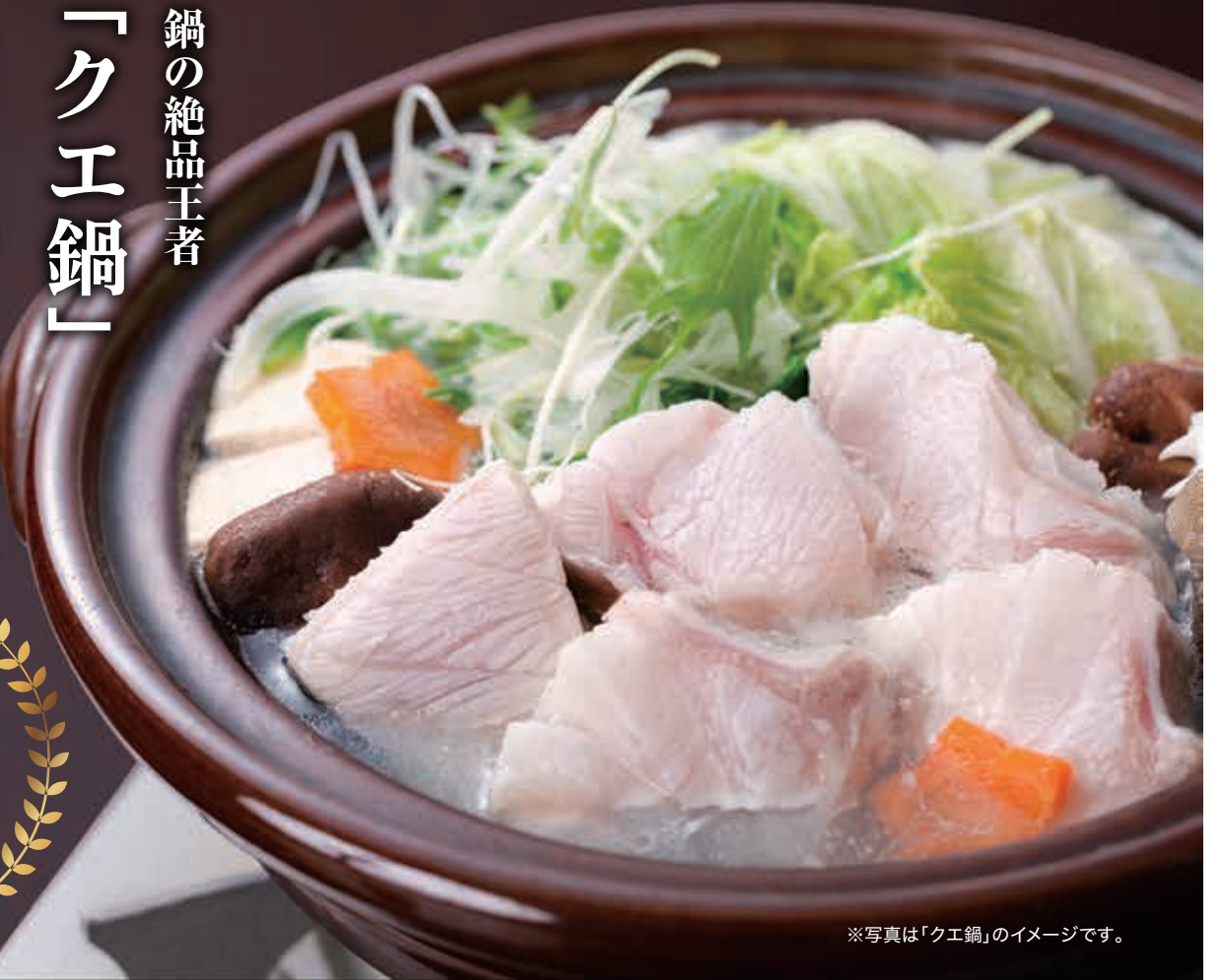
※写真は「クエ鍋」のイメージです。