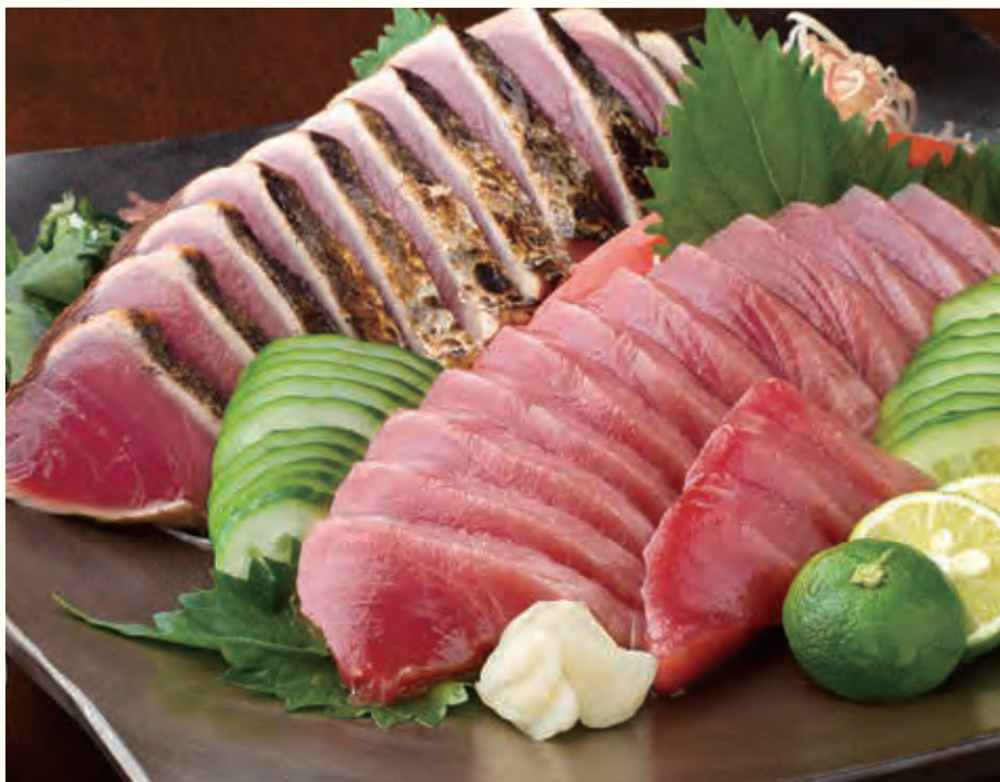
※写真は「鰹のたたき・鰹の刺身セット」のイメージです。