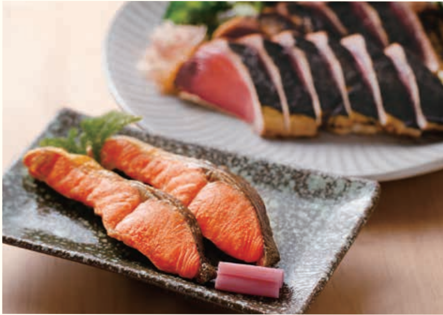
※写真は「新物 天然紅鮭・鰹のたたきセット」のイメージ写真です。