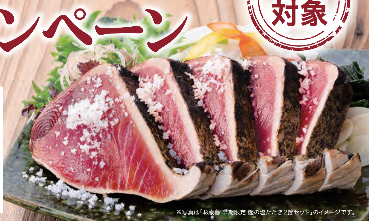
※写真は「お歳暮 早期限定 鯉の塩たたき2節セット」のイメージです。