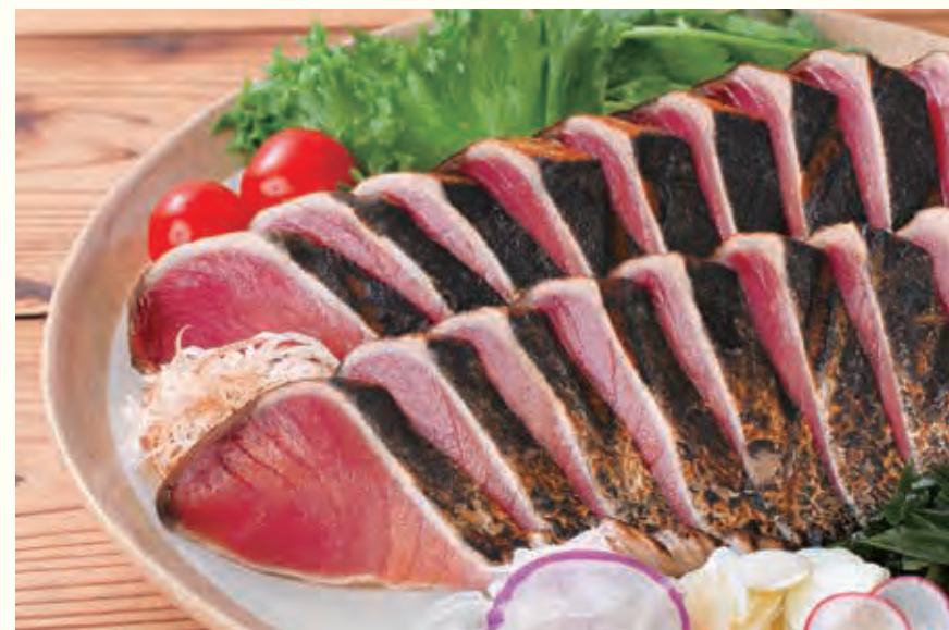
※写真は「鰹のたたき」のイメージです。